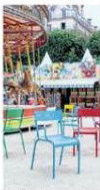
Fermob : du mobilier intemporel qui sait se réinventer. Page 28

Les envies de voyages s'expriment avec des imprimés traditionnels asiatiques ou africains, même si les pièces fortes, comme le canapé, restent encore sur la sobriété, à grand renfort de tons gris, pourpre ou taupe. Le mobilier industriel ne séduit plus exclusivement les fans de récup, mais un public plus large, amateur de ces éléments toujours bien pensés. Surtout, les plus petits budgets pourront jouer la carte de la nouveauté en piochant deux ou trois idées parmi les nombreuses nouveautés de ce printemps. Revue de détail des meilleures suggestions déco-entre Aix et Marseille.