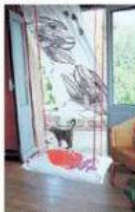
Chez Baleine Rouge, un objet stylisé à pour-faites comme d'habitude. Page 28